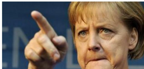
Angela Merkel als Bundeskanzlerin erklärte: „Die Pandemie ist erst vorbei, wenn alle Menschen auf der Welt geimpft sind.“