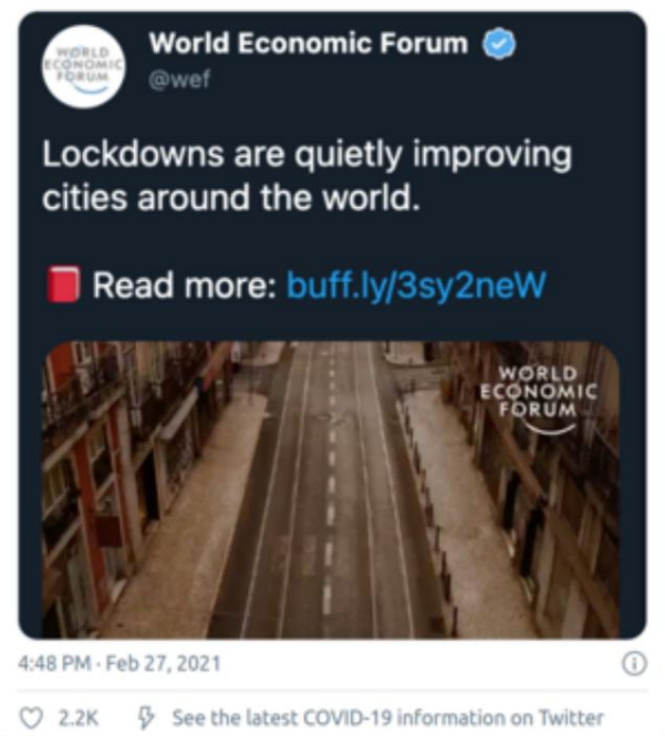
Ein WEF- Tweet, der schnell gelöscht wurde, nachdem er Kritik hervorgerufen hatte.