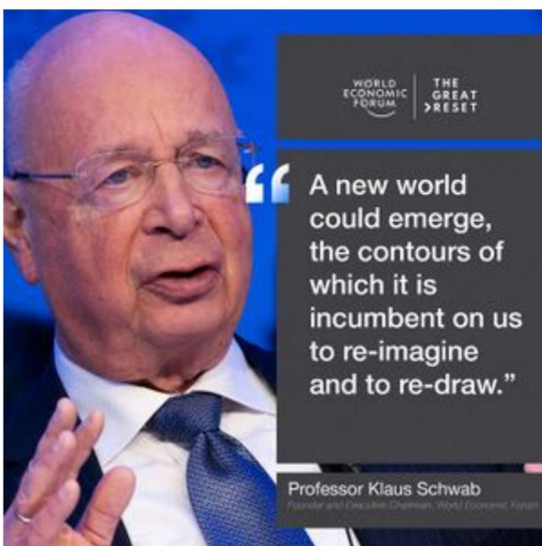
Klaus Schwab, ehemaliger Bilderberg-Lenkungsausschuss

Der Great Reset ist ein SDS- Versuch, die wirtschaftliche Ungleichheit in ein positives Licht zu rücken: „Du wirst nichts besitzen und glücklich sein.“ COVID-19 hat die wirtschaftliche Ungleichheit erheblich verschärft, da kleine und mittlere Unternehmen in den Hintergrund gedrängt wurden, während in Friedenszeiten beispiellose Erhöhungen der Geldmenge und des Unternehmenswohls an einige wenige große Organisationen verteilt wurden.