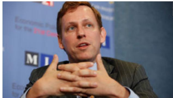
Peter Thiel, Mitbegründer und größter Anteilseigner von Palantir, das stark im Crunching engagiert ist COVID-Daten

Jutta Urpilainen (3. Februar 2021) [111]