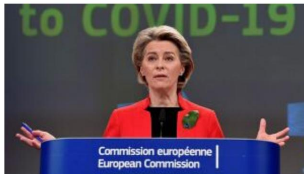
Ursula von der Leyen, eine Figur von großer Bedeutung für das COVID-19-Ereignis