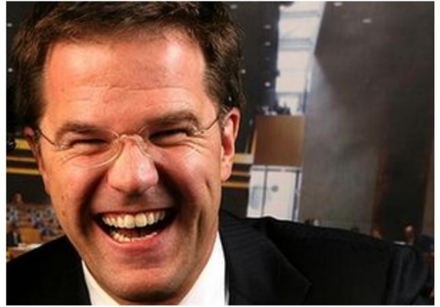
Mark Rutte, sechsmaliger Bilderberg-Besucher, entließ als niederländischer Premierminister seine Wirtschaftsministerin

Mona Keijzer, kurz nachdem sie den niederländischen Impfpass öffentlich kritisiert hatte. [152]