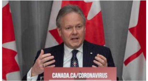
Stephen Poloz spricht im März 2020. [199]