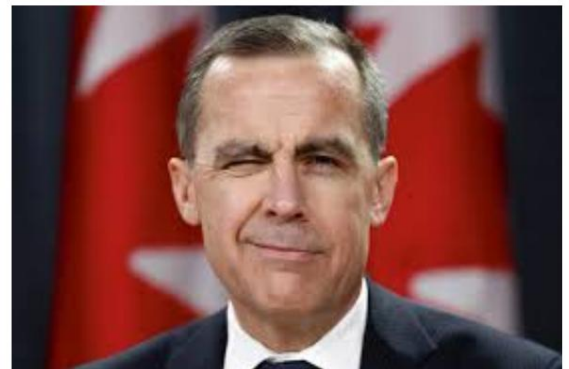
Mark Carney, Trinationaler, Quad-Bilderberger, Gouverneur der Bank of England bis März 2020, dann wurde er „informeller Berater“ von Premierminister Justin Trudeau