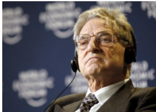
George Soros von The Good Club steht im Verdacht, die Erzählung durch Gruppen wie BLM kontrolliert zu haben