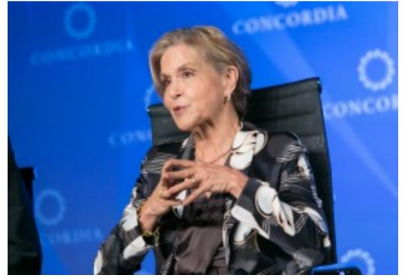
Judith Rodin nahm 2010 an der Lock-Step - Übung teil , bei der es darum ging, eine Pandemie zu nutzen , um den High-Tech- Totalitarismus einzuleiten

Im Frühjahr 2020 bildeten viele Nationalstaaten COVID-19-Task Forces, von denen viele über „Ausnahmestatusbefugnisse“ verfügten oder so taten, als hätten sie die Standardarbeitsanweisungen außer Kraft gesetzt.